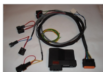
Precision Quickshifter 8 Kit (PQ8) Full gass elektronisk girskifte, sømløs akselerasjon...

Roadracing sykler, Gatesykler, Dragrace sykler, Gokarts, Crosskarts, i grunnen hva som helst med sekvensiell girboks.